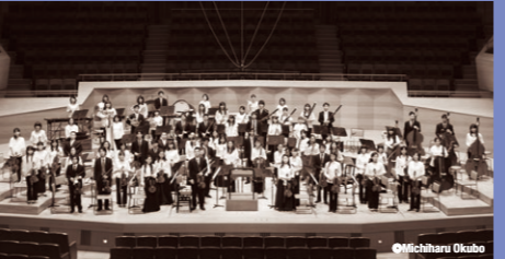
管弦楽 小澤征爾音楽塾オーケストラ Orchestra: Seiji Ozawa Music Academy Orchestra