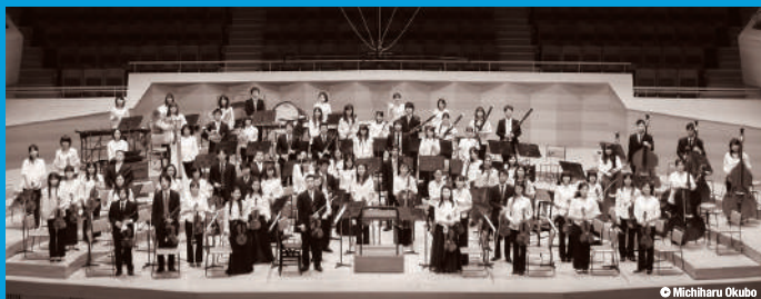
管弦楽 小澤征爾音楽塾オーケストラ

Orchestra: Seiji Ozawa Music Academy Orchestra