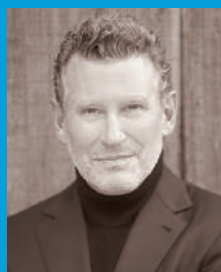
演出 デイヴィッド・ニース Stage Director: David Kneuss